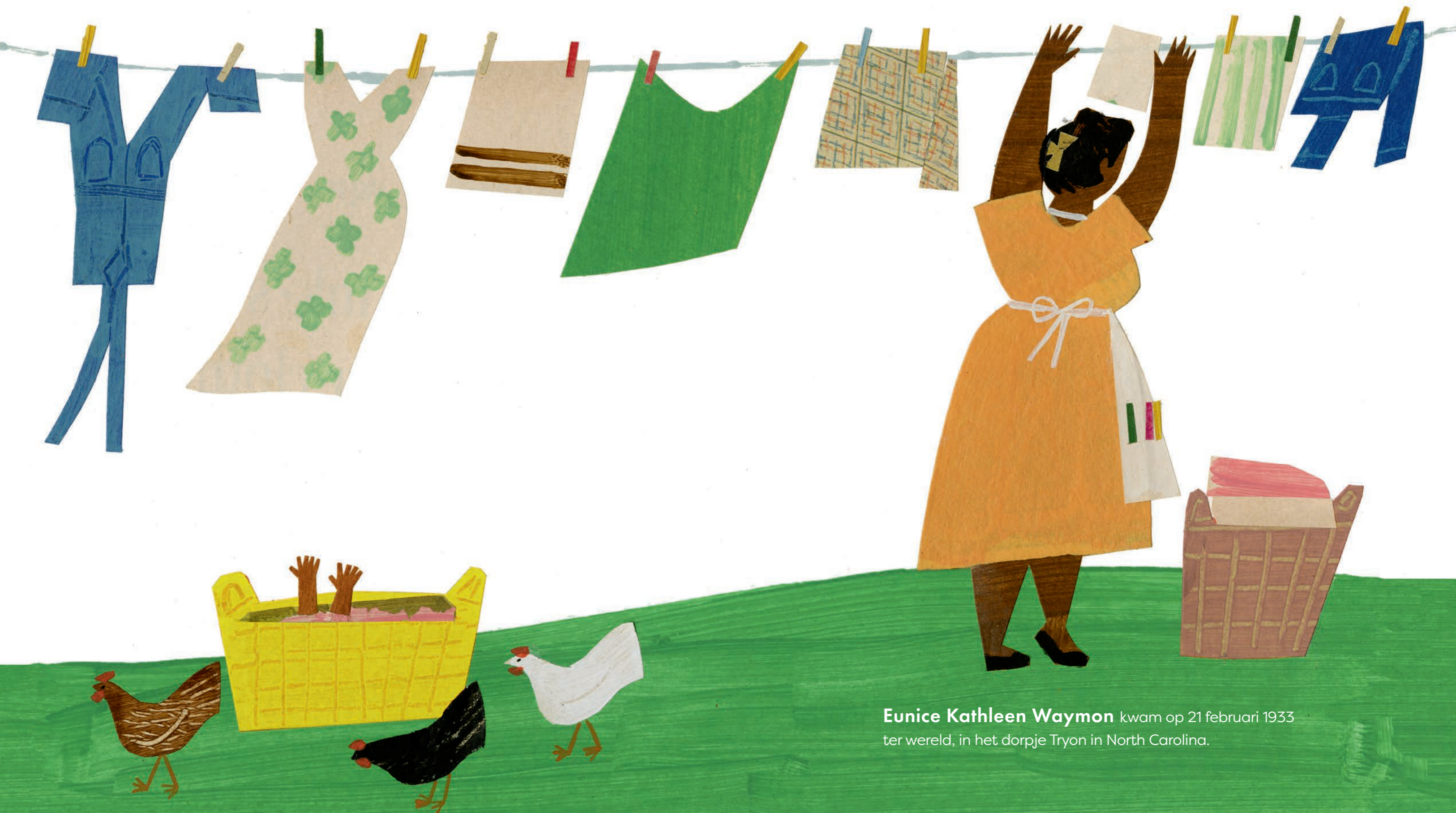
Eunice Kathleen Waymon kwam op 21 februari 1933 ter wereld, in het dorpje Tryon in North Carolina.